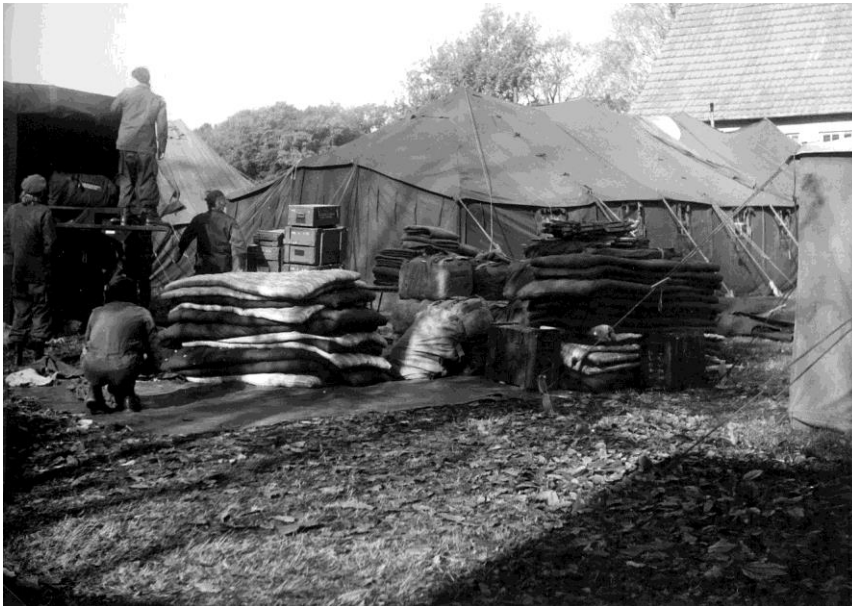
(opbreken van het kamp)

De oude hoofdmeester woonde nog naast het gesloten gebouw. Die ontmoette ik een keer en ben toen een paar keer op de koffie met Schnapps geweest. Heel aardig om zijn ervaringen op school voor de oorlog te horen. Zelfs toen het kamp werd afgebroken was ik bij hem op visite en zag vanuit zijn raam hoe het werk buiten vorderde.