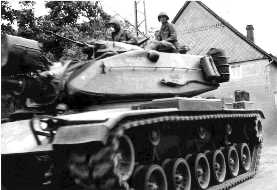
(Amerikaanse tank tijdens oefening Uni Plus)

Ik zag prins Bernhard daar trouwens ook heel even.