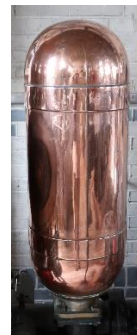
En zo ziet hij er in werkelijkheid uit

De Merryweather, de voedingspomp van onze de stoomketel nummer 4 en veel andere pompen in het Stoommachinemuseum hebben een apparaat zoals hierboven is getekend. Dat is een luchthelm, die ook wel windketel wordt genoemd. Al die pompen werken met een zuiger en ze zijn dubbelwerkend, net als alle stoommachines. Kijk hiervoor als je wilt nog even naar aflevering 4 "Hoe werkt een stoommachine".